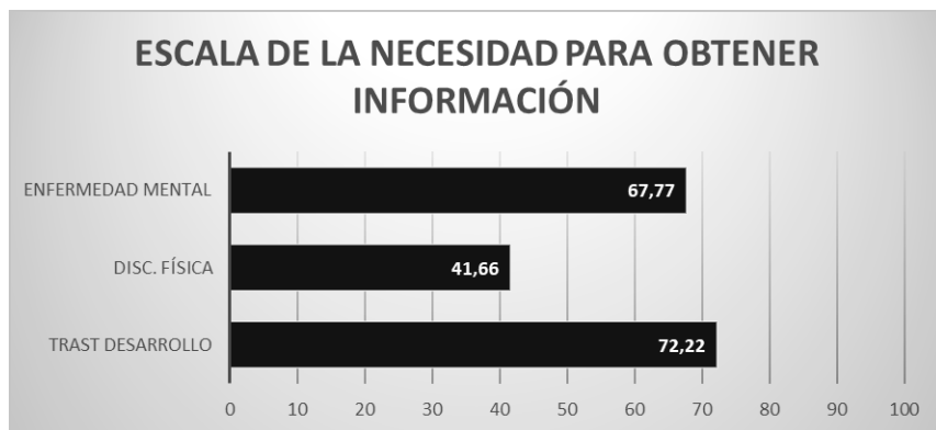
Gráfica 1. Comparativa de necesidades para obtener información según diagnósticos.

Valorando las necesidades que presentan las familias participantes teniendo en cuenta el diagnóstico de la/s persona/s con discapacidad en el núcleo familiar, comprobamos que tener un miembro con trastorno del neurodesarrollo (p.e., autismo, discapacidad intelectual...) supone grandes necesidades en cuanto a la necesidad de obtener información (Gráfica 1).