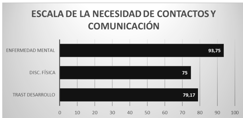
Gráfica 4. Comparativa de necesidades de contactos y comunicación según diagnósticos.